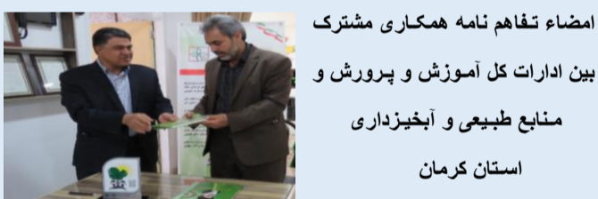
امضاء تفاهم نامه همکاری مشترک