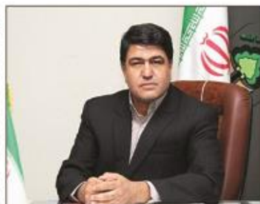
مدیرکل منابع طبیعی و آبخیزداری استان کرمان با توجه به افزایش دما در فصل تابستان، از احتشمال وقوع آتش سوزی در جنگل‌ها و مراتع این استان خبر داد.

مدیرکل منابع طبیعی استان با بیان اینکه فعالیت های آموزشی و ترویجی در دستور کار اداره کل منابع طبیعی استان قرار دارد، بیان کرد: در این خصوص