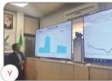
پایبندی مصرف برق در کرمان از قطع ادارات پر مصرف تا لزوم استمرار صرفه جویی