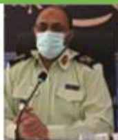
امادگی پلیس و دیگر نهادهای امنیتی نظامی برای خدمت رسانی به زائران اربعین