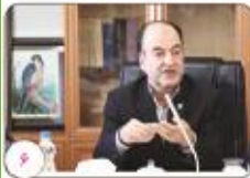
اجرای مرحله ششم طرح ملی ایمن سازی طبور یوسی و روسای علی بهماری نیوکامل در سراسر استان کرمان