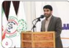
احداث سه پل آسپدیده از سیل توسط شهرداری رفسنجان