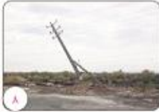
مدیرعامل شرکت توزیع نیروی برق شمال استان خرمشهر اصلاح شبکه آسیب دیده رفسنجان در کوتاهترین زمان