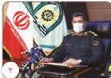
سارقان بسته کاظم آباد در دام پلیس