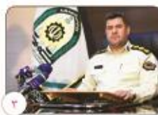
طرح ارتقاء امنیت اجتماعی به مدت چهار روز در شهرستان کرمان اجرا شد