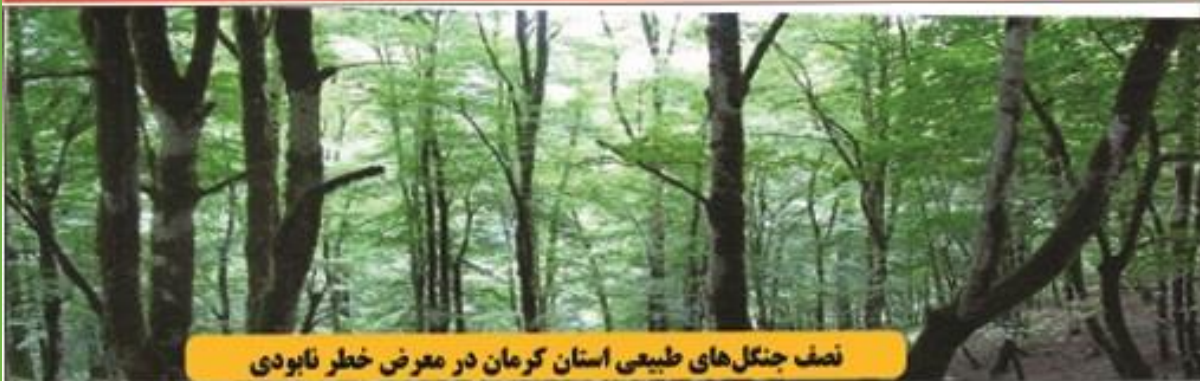
نصف جنگل‌های طبیعی استان کرمان در معرض خطر نابودی