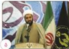
در ترویج فرهنگ زکات کوتاهی شده است