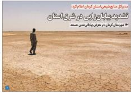
مدیرکل منابع طبیعی استان کرمان اعلام کرد: تشدید بیابان‌زایی در شرق استان ۱۳ شهرستان کرمان در معرض بیابان‌شدن هستند

شماره ۱۳ - شماره ۱۳ - شماره ۱۳ - شماره ۱۳ - شماره ۱۳