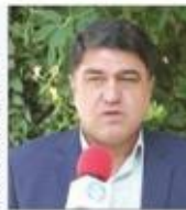
مدیرکل منابع طبیعی و آبخیزداری استان کرمان

مدیرکل منابع طبیعی و آبخیزداری استان کرمان می گوید: تقریباً ۲۵ درصد بیابان های کشور در استان کرمان هستند. مهدی رحیمی زاده با اشاره به مرز ۵۰۰ کیلومتری استان کرمان با بیابان نوبت اظهار کرد، استان کرمان تحت تاثیر غواض منعی بیابان قرار