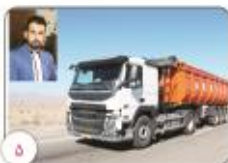
۵ طی سه ماهه نخست اسفل بیش از ۳۸۵ هزار برگ بارنامه در استان کرمان صادر شد