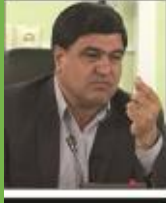
نصف جنگل‌های طبیعی استان کرمان در معرض خطر نابودی

هر باعداد در استان کرمان - سال بیست و نهم