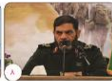
فرمانده سپاه تازانه استان کرمان سپاه در چارچوب وظیفه شرعی خود به شورای نگهبان کمک می کند