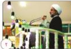
نام جمعه دولت کرمان گشایش اقتصادی کشور در راه است