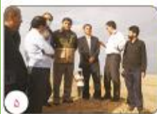
بازدید مدیر کل منابع طبیعی و آبخیزداری استان کرمان از پروژه های آبخیزداری