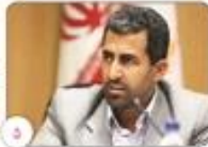
رئیس انجمن تیمهای مجلس احتمال فراخوان ثبت نام جاماندگان سهام عدالت تا اواسط تابستان