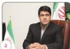
۵ عوامل انسانی دارای بیشترین سهم در آتش سوزی طبیعت