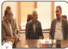
حضور مدیرکل و جمعی از مدیران ارشد سازمان بازرسی استان در شرکت گاز به عنوان یکی از دستگاه های برتر در عملکرد