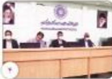
رئیس اتاق کرمان تدابیر لازم در تحمیل خاموشی به صنایع آندیشده شود