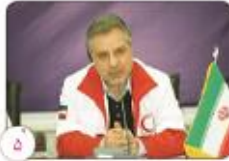
رئیس سازمان اسکان و مسکن زیور ساخت های پاسخ به حوادث در استان کرمان باید تقویت شود