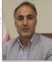
تغییرات در مدیریت بحران استانداری کرمان