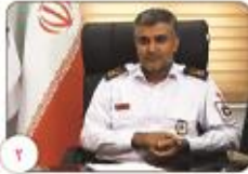
آتش نشانان کرمانی در نیر ماه جان ۱۲۳ نفر را نجات دادند