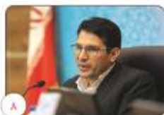
۸ رئیس سازمان مدیریت و برنامه ریزی استان اعلام کرد: وجوه ۳۰۰۰ پروژه نیمه تمام در استان کرمان