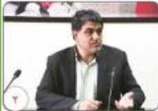
مدیر کل منابع طبیعی استان خیر داد سوختن ۳۲ هکتار از مراتع شمال استان کرمان در سال جاری