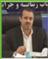
جذب ۱۹ میلیون دلار سرمایه گذاری خارجی در کرمان