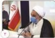
ازوم تعیین تکلیف پروژه انتقال آب از سد شهیدان امیر تیموری با پیگیری دستگاه های اجرایی