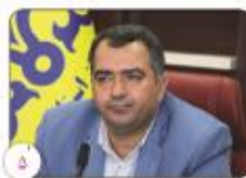
موفقت شرکت گاز استان کرمان در تعدید ۵ گواهینامه استاندارد بین المللی