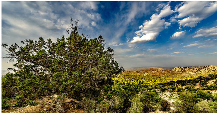
ذخیره گاه ارس - گلوچار شهرستان رابر - استان کرمان