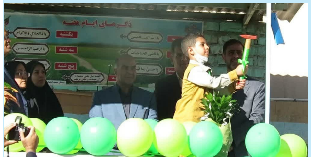
نواختن زنگ درختکاری در کرمان

وی دانش آموزان را تاثیرگذارترین قشر جامعه در توسعه جوامع دانست و خاطرنشان کرد: باید برای ایجاد حساسیت در بدنه اجتماعی، دانش آموزان را به عنوان ساکنان آینده کشور به میدان عمل وارد کرد و یکی از دلایل نواختن زنگ درختکاری در مدارس حساس کردن مردم نسبت به منابع طبیعی و توجه به توسعه پایدار است در دین مبین اسلام همواره به درختکاری توجه و توصیه شده و این خود بیانگر اهمیت بالای توجه به درخت و درخت کاری است.