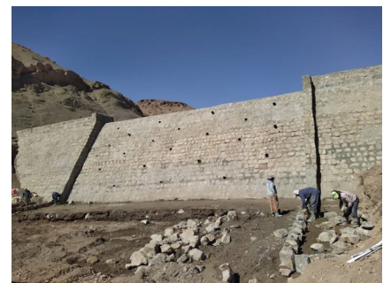
پایان عملیات ساخت بند سنگی ملاتی عسکروئیه راین

او بیان داشت: این سازه با هدف کنترل سیلاب و رسوب، جلوگیری از فرسایش خاک و تغذیه سفره‌های آب زیرزمینی، افزایش آبیگری چاه‌ها، قنوات و تامین آب شرب روستاهای اطراف اجرا و نقش موثری در جلوگیری از خسارت‌های احتمالی به اراضی پایین دست این حوزه خواهد داشت.