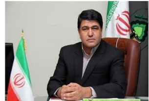
ایران در یک قدمی ورشکستگی آبی/ استان کرمان، بحرانی تر از خوزستان

ایسنا/کرمان مدیرکل منابع طبیعی و آبخیزداری شمال استان کرمان در پاسخ به این سوال که آیا ایران به مرز ورشکستگی آب رسیده؟ گفت: وقتی که در ایران حدود ۹۰ میلیارد مترمکعب از ۱۱۰ میلیارد مترمکعب آب را مصرف کرده ایم بنابراین ما وارد مرز ورشکستگی آبی شده ایم و این مسئله ای نیست که بتوان آن را پنهان کنیم.